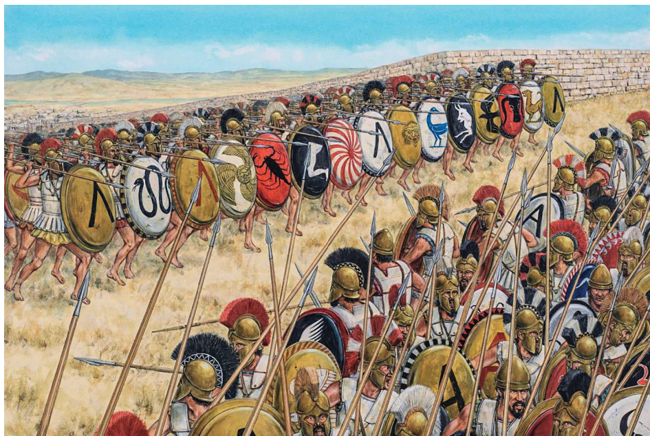
Две фаланги времен Пелопоннесской войны. Художник: Adam Hook

Каждый свободный город-государство Древней Греции формировал собственное войско, в основе которого находилась тяжелая пехота – гоплиты. Защитное вооружение такого воина состояло из большого круглого щита, нагрудника, шлема и поножей. Основным оружием было копье длиной около 2 м, а вспомогательным – короткий меч. Строились тяжело вооруженные греки в плотный боевой порядок – фалангу. Это было линейное построение с определенным количеством рядов: чаще всего 8. Однако нередки случаи, когда фаланга образовывала глубину в 12 или даже 25 человек. Ксенофонт в труде «Элленика» сообщает, что в битве при Левктрах