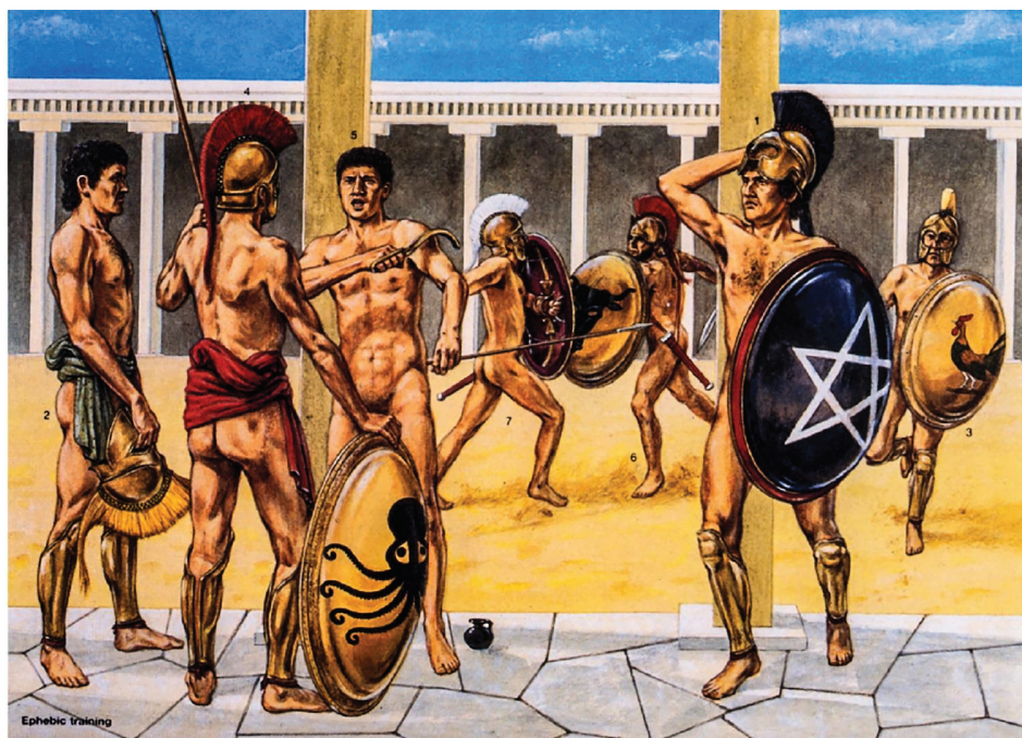
Эфебы тренируются. Художник: Adam Hook

Древние греки, как известно, чтили сразу двух богов войны. Неистового Ареса и благородную Афины. На совесть первого списывались весь фанатизм и вероломства, сопутствующие боевым действиям. Вторая тяготела хитроумной стратегии и индивидуальным поединкам, отчего слыла благородным персонажем.