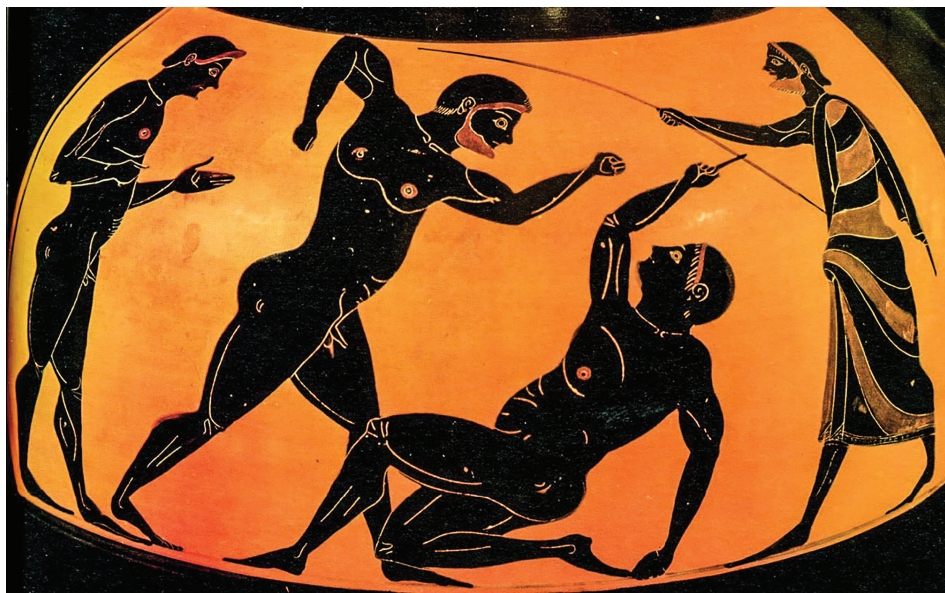
Панкратион как он есть, тут и судья с незамысловатым прутом. Древнегреческая вазапись

Панкратион (название в переводе означает «всеобщая мощь») был весьма популярен в древнем мире. Настолько, что вытеснить его смогли только гладиаторские бои. Тем не менее, не по всей ойкумене сражения с оружием выдавили из сердец зрителей старую добрую потасовку без правил. Когда Рим, поглотивший мир прежней Греции, стал доминировать над большей частью земли обитаемой, панкратион оказался удивительно популярен в Египте – своеобразном форпосте «чистой античности».