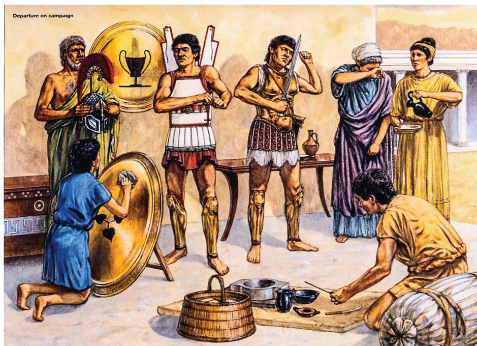
Граждане идут в поход. Художник: Adam Hook

Для учета мужского населения, имевшего право в будущем стать полноправными гражданами, греков в возрасте 17–18 лет вносили в специальные списки. После чего каждый из них давал клятву, текст которой дошел до наших дней, и становился эфебом.