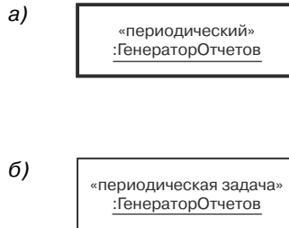
Рис. 2. Альтернативные нотации для активных объектов (задач) в UML: а – стандартная нотация UML для активных объектов; б – вариант, используемый, если стандартная нотация активных объектов не поддерживается

В этой книге применяется стандартная нотация UML для обозначения активных (в методе COMET они называются задачами) и пассивных объектов. В UML прямоугольник активного объекта рисуется с жирной рамкой, а прямоугольник пассивного объекта – с тонкой (см. главу 2). Некоторые CASE-средства не поддерживают такой стандарт, поэтому активные и пассивные объекты оказываются визуально неразличимыми. В COMET слово «задача» обычно не употребляется в имени стереотипа активного объекта. Как показано на рис. 2а на примере объекта Генератор Отчетов, для этой цели достаточно прямоугольника с жирной рамкой. Если же такой визуальный эффект не поддерживается, то в имя стереотипа можно вставить слово «задача» (см. рис. 2б).