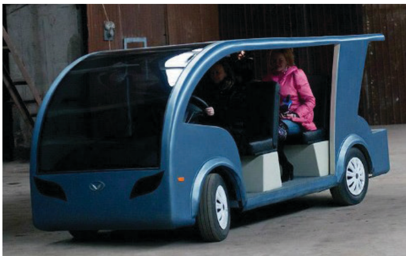
Рис. 1.5. Малый электрокар российского производства

В России небольшими партиями собирается единственный отечественный электромобиль – Lada Ellada. Да, да, читатель, такие тоже имеют место. Кроме того, в окрестностях Астрахани налажен выпуск уникальных в своем роде электромашин – малых электрокаров (рис. 1.5). Размах технологий новых автомобилей не знает границ: аккумуляторами управляет микропроцессорная система контроля.