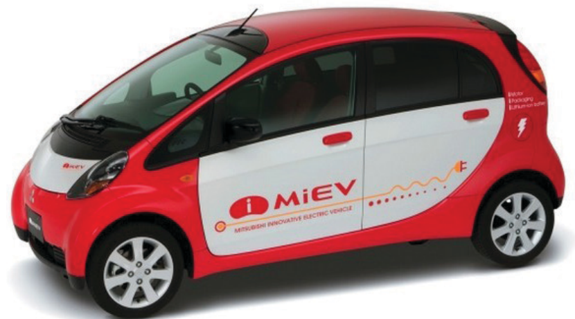
Рис. 1.4. Самый популярный в России электромобиль

«б) приоритетные направления научно-технологического развития российского автомобилестроения и разработки перспективных образцов автомобильной техники с учётом мировых тенденций перехода к серийному производству электромобилей;» (Пр-66, п. 1).