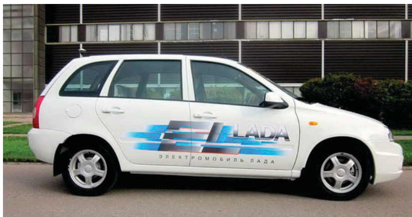
Рис. 1.3. Внешний вид отечественного автомобиля «Лада Эллада»

Впрочем, и АвтоВАЗ имеет опыт производства электромобилей. Два года назад компания выпустила электрический автомобиль Lada Ellada (рис. 1.3), который был построен на базе автомобиля Lada Kalina. Эта модель не поступила в серийное производство и была произведена небольшой партией на заказ.