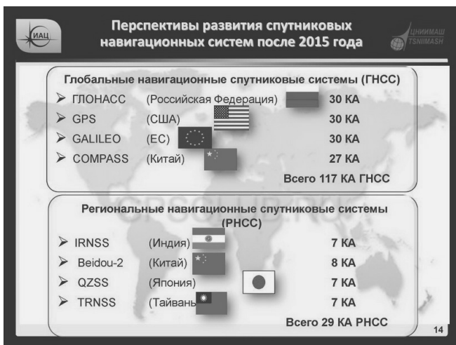
Рис. В.0. Системы ГЛОНАСС в разных странах мира

В США действует аналогичная по функционалу американская «GPS». Подобные системы есть (по принадлежности спутников) в Индии, Китае и других странах. На рис. В.0 показано, как развивают аналогичные системы в разных странах мира.