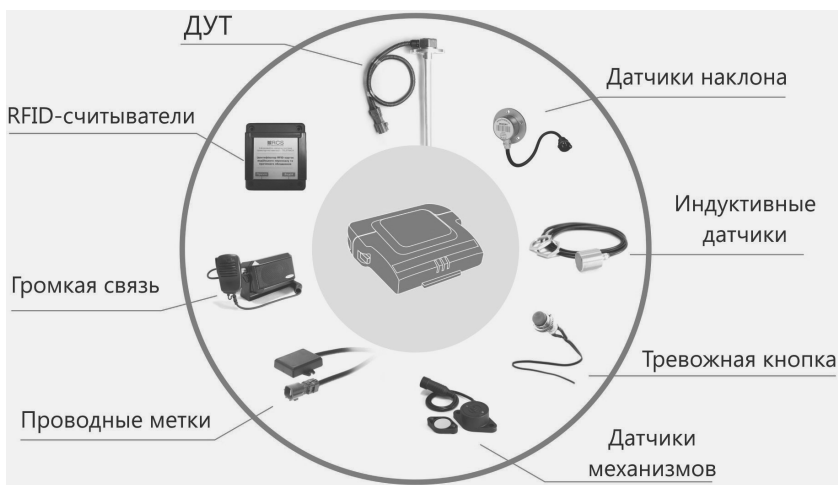
Рис. 1.5. Схема взаимодействия устройства с различными электронными датчиками, устанавливать которые на конкретном автомобиле можно опционально

На рис. 1.5 представлена схема взаимодействия устройства с различными электронными датчиками, устанавливать которые на конкретном автомобиле можно опционально.