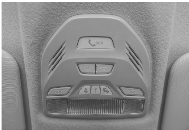
Рис. 1.3. Участок панели ГЛОНАСС автомобиля Lada Vesta