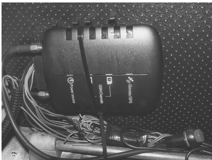
Рис. 1.7. Вид на фактически подключенное устройство «Сигнал S-2551»

На рис. 1.7 представлен вид на фактически подключенное устройство «Сигнал S-2551» в автобусном парке ФГУП «Пассажир-автотранс» (Санкт-Петербург).