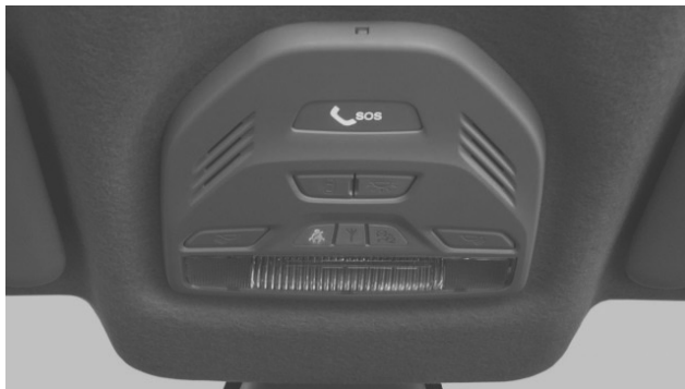
Рис. 1.4. Вид на панель ГЛОНАСС китайского автомобиля Great Wall Hover

На рис. 1.4 представлен вид на панель ГЛОНАСС китайского автомобиля Great Wall Hover выпуска 2014 года.