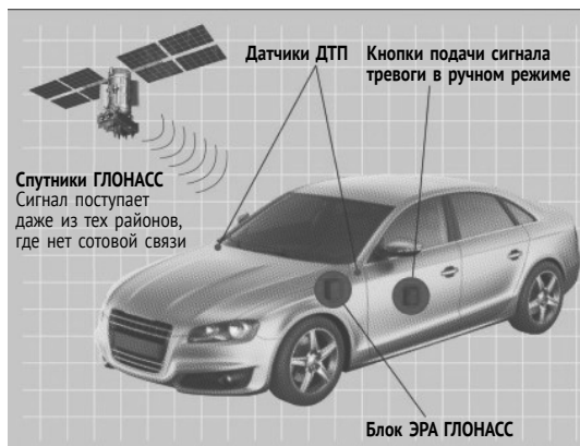
Рис. 1.1. Функционал работы ГЛОНАСС в режиме обеспечения транспортной безопасности на дорогах

Затем включается диспетчерский пункт системы 112. Диспетчер инициативно производит переговоры с водителем (ГЛОНАСС оснащена обратной связью, микрофоном и динамиком, работающими в полнодуплексном (от англ. full-duplex ) режиме – говорить и слушать можно одновременно) и по ситуации организует выезд служб экстренного реагирования – МЧС, ГИБДД, Скорая помощь (могут быть задействованы иные службы). Вот так оно задумано. Функционал схематически показан на рис. 1.1.