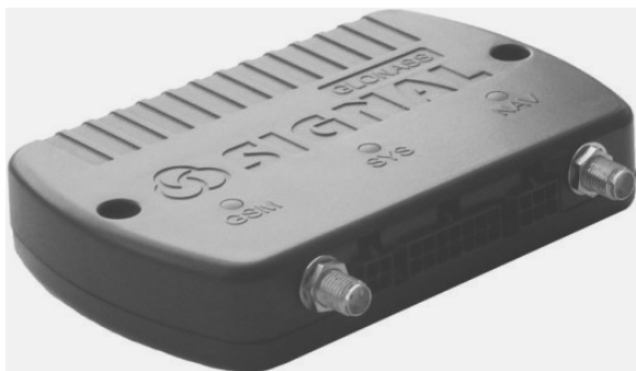
Рис. 1.6. Внешний вид устройства «Сигнал S-2551»

На рис. 1.7 представлен вид на фактически подключенное устройство «Сигнал S-2551» в автобусном парке ФГУП «Пассажир-автотранс» (Санкт-Петербург).