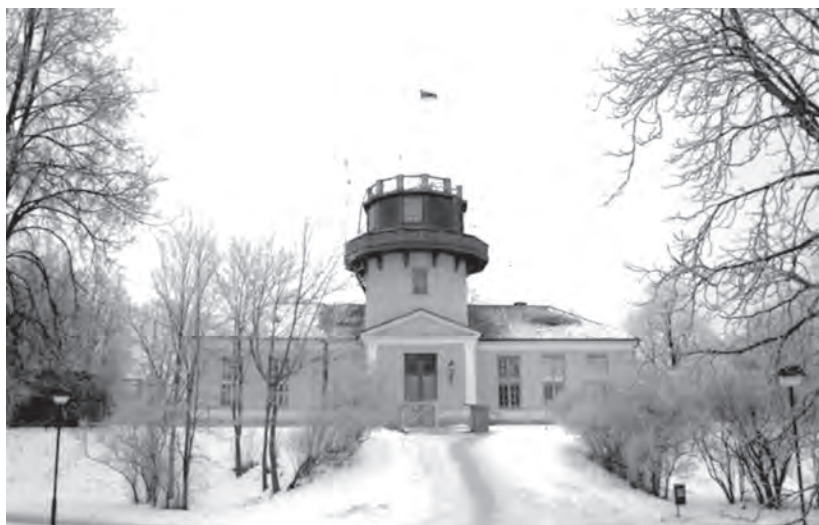
Рис. 3. Старая обсерватория в Тарту.

сти. Этой работой мне удалось показать, что в верхней части главной последовательности, в области горячих гигантов, скорости звезд можно с хорошей точностью представить одним равновесным распределением; таким образом, эту популяцию можно считать однородной. В нижней части главной последовательности скорости нельзя представить одним равновесным распределением: как показывает кинематика, эта популяция неоднородна, в ней старые звезды соседствуют с относительно молодыми. Этого и следовало ожидать: в нижней части главной последовательности развитие звезд происходит очень медленно, поэтому старые и молодые звезды в ней присутствуют вместе.