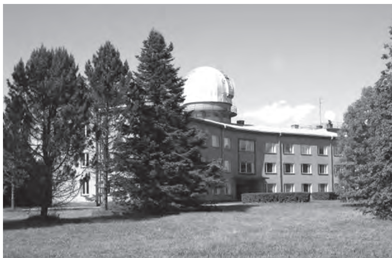
Рис. 4. Главное здание новой обсерватории в Тыравере.

литературой. Сначала вместе с парой молодых астрономов мы перевели с русского языка на эстонский учебник астрономии, а затем существенно его переработали. К сожалению, наша переработка была недостаточно основательной, так что в тексте остались отдельные детали, отражающие советский дух.