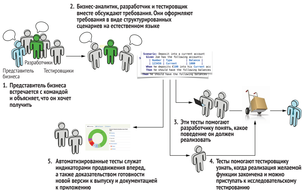
Рис. 1.2 В BDD широко используется обсуждение бизнес-правил и примеров, выраженных в форме, которую легко автоматизировать, благодаря чему уменьшается вероятность потери информации и недопонимания