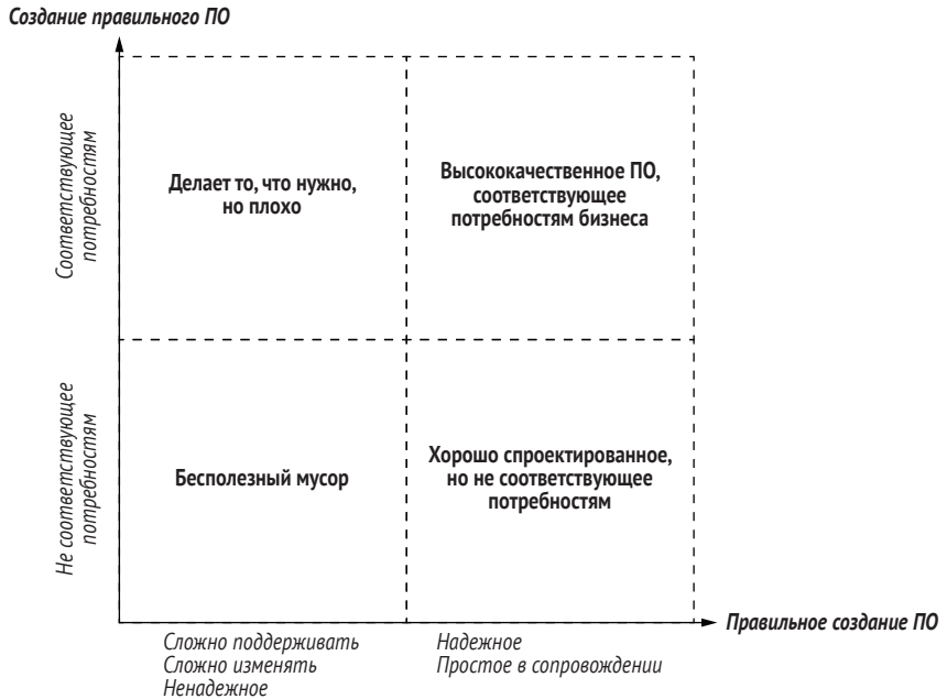
Рис. 1.3 Для успеха проекта необходимо правильно создавать правильное программное обеспечение