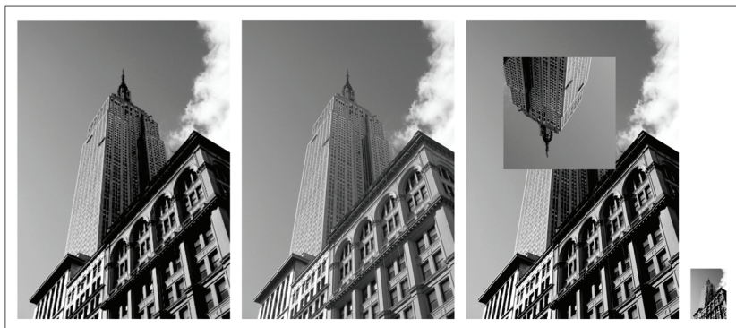
Рис. 1.1. Результаты обработки изображений с помощью PIL

Ниже приведено несколько примеров, заимствованных из документации по PIL на странице http://www.pythonware.com/library/pil/handbook/index.htm . Результаты их работы показаны на рис. 1.1.